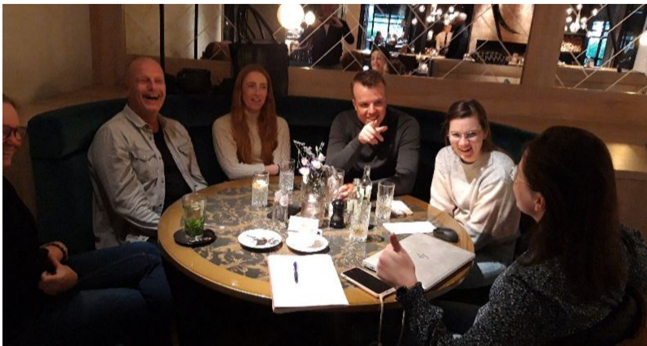
De werkgroep CMV in actie tijdens één van de vele overleggen

armbandjes, een "schijf je rijk" lot of een heerlijk bierpakket. Gewoon sponsoren van een deelnemer wordt natuurlijk ook zeer op prijs gesteld.